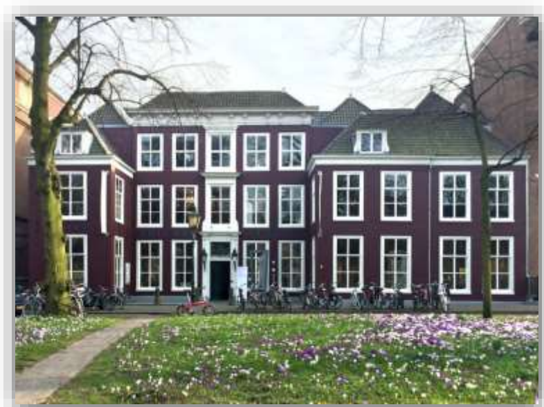
Pulchri, Den Haag

De avonden in Pulchri beginnen om 18.00 en duren tot ongeveer 21.00, met borrel en warm buffet. Zowel voorafgaand als na afloop is er gelegenheid om informeel bij te praten. Online wisselde de aanvangstijd, en het sociale element varieerde van een informele inloop tot uiteen gaan in kleine groepjes om na afloop van de presentatie na te praten.