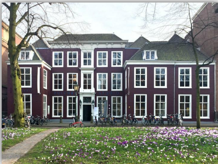
Pulchri, Den Haag

De avonden in Pulchri beginnen om 18.00 en duren tot ongeveer 21.00, met borrel en warm buffet. Zowel voorafgaand als na afloop is er gelegenheid om informeel bij te praten. Online wisselde de aanvangstijd, en het sociale element varieerde van een informele inloop tot uiteen gaan in kleine groepjes om na afloop van de presentatie na te praten.