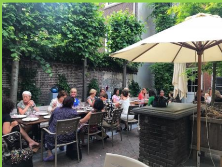
In de binnentuin van Pulchri

Onze jaarlijkse Kerstbijeenkomst was bij restaurant Pan in Bezuidenhout. Onder het genot van een shared diner kregen we les in etiquette. Drie leden maakten deze avond mogelijk.