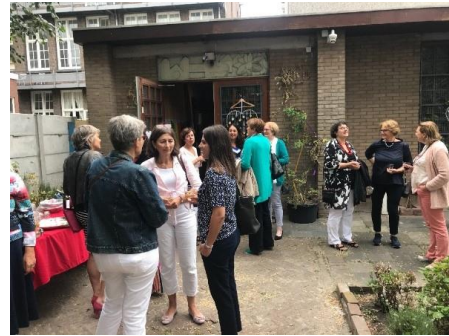
Multicultureel Ontmoetingscentrum in de Schilderswijk

Voor de Zomerbijeenkomst kwamen we bij elkaar in het multicultureel ontmoetingscentrum in de Schilderswijk. We aten van een voortreffelijk, multicultureel buffet, voorafgegaan door een djembé workshop. Drie nieuwe leden waren de organisatoren.