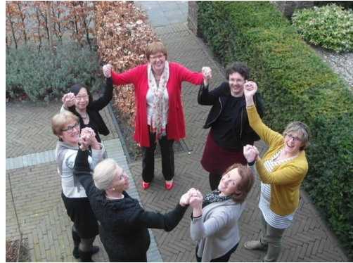
De Cirkel opgericht in 2001

De oudste cirkel is opgericht in 2001 en bestaat uit zeven leden. De dames komen maandelijks bijeen. Per keer bereidt één persoon een actueel onderwerp voor ter bespreking/discussie met de anderen. Een en ander onder het genot van een gezamenlijk etentje, per toerbeurt bij iemand thuis.