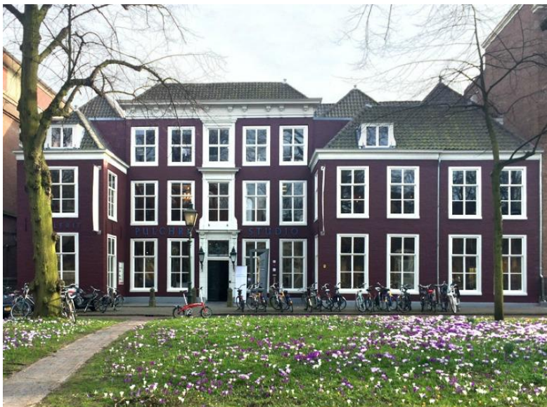
Pulchri, Den Haag

De avonden in Pulchri beginnen om 18.00 en duren tot ongeveer 21.00, met borrel en warm buffet. Zowel voorafgaand als na afloop is er gelegenheid om informeel bij te praten.