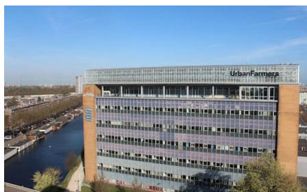
Het oude Philipsgebouw van Urban Farmers

Traditioneel worden de nieuwjaarsbijeenkomst, de zomerbijeenkomst en de kerstbijeenkomst door de nieuwe leden van het jaar ervoor georganiseerd.